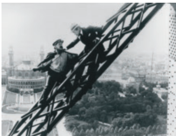
Paris sover (20/9)