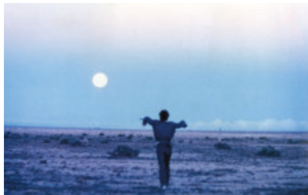
Dot grymma landet (29/10)