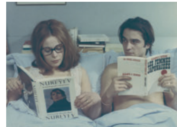
Älskar – älskar inte (10/9)