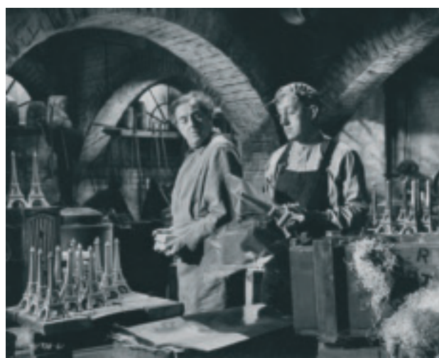
Jag stal en miljon (26/11)