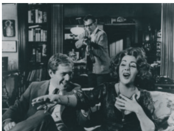
Vem är rädd för Virginia Woolf? (14/11)