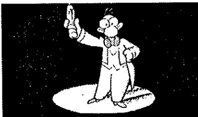
Filmens ciseron i berättartagen.

många är fattiga. Några kan själva bestämma, andra får finna sig i att vara förtryckta. Några genomgår bantningskurer, andra svälter. Med dessa dialektiska ord på vägen tar filmen farväl.