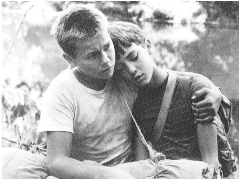
Chris och Gordie, River Phoenix och Wil Wheaton, i Rob Reiners "Stand by me".

Deras planering är bristfällig, och ingen av dem har tänkt på att ta med sig mat. Lite pengar har de däremot.