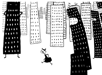
Fröken Märkvärdig & karriären.